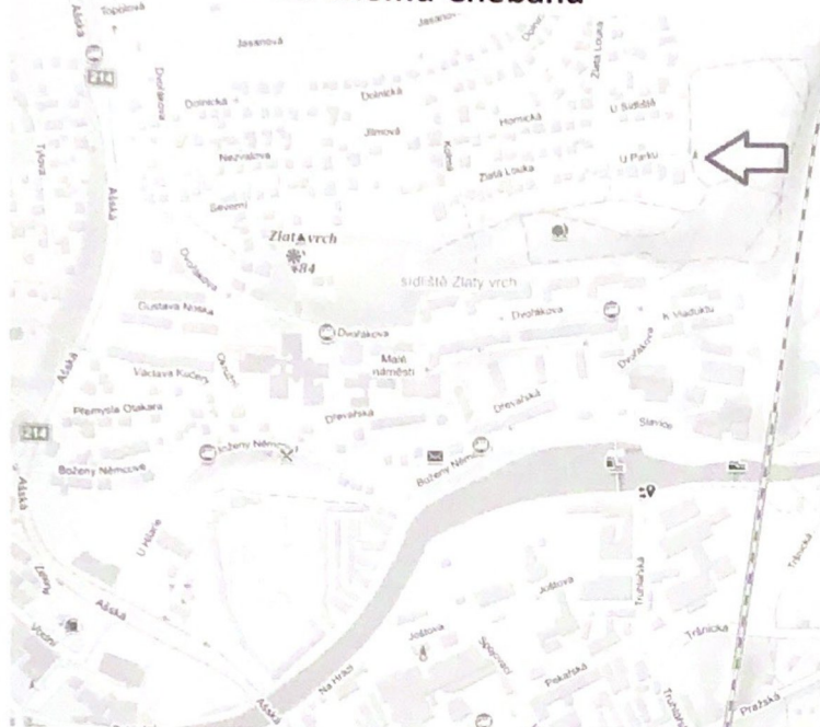
Lokace pomníku Zemského sněmu Chebanů