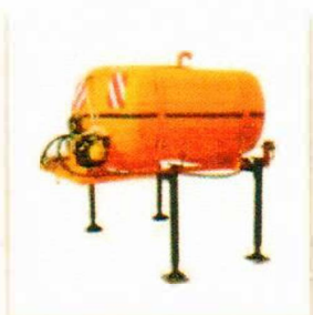
Mycí a kropící nástavba