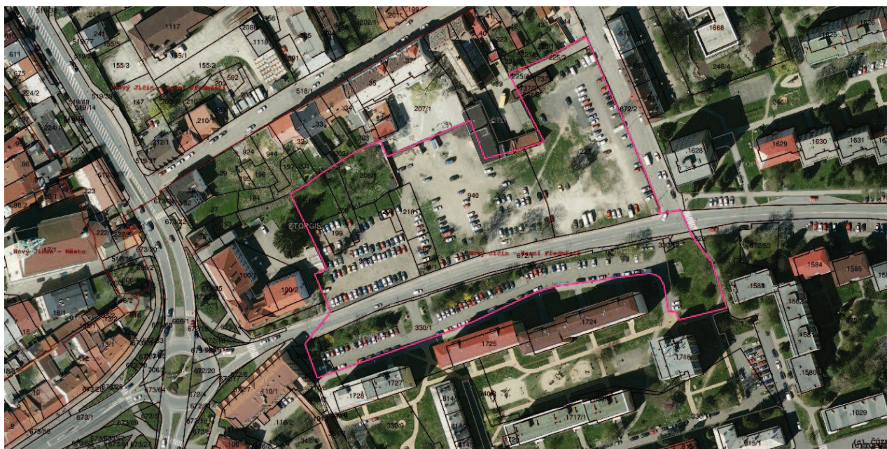
Obr. 1: Vymezení řešeného území

Plošný rozsah studie je vymezen v Územním plánu Nový Jičín v rozsahu přestavbové plochy P1 a dále části přilehlé ulice Bezručova včetně veřejného prostoru před bytovými domy.