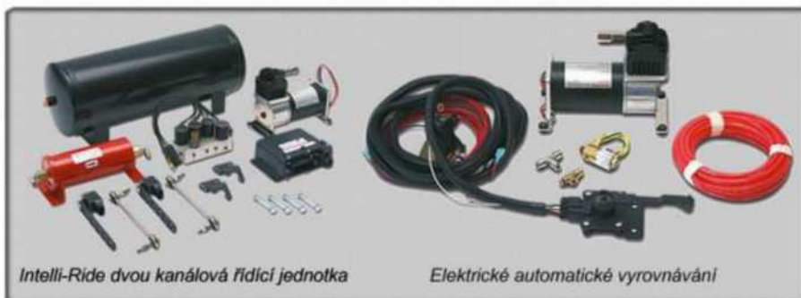
Intelli-Ride dvou kanálová řídicí jednotka