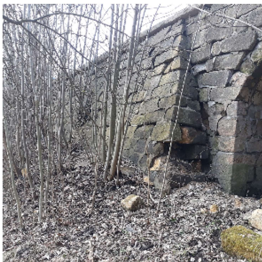
Silnice III/27814 Záskalí, opěrná zeď včetně propustku