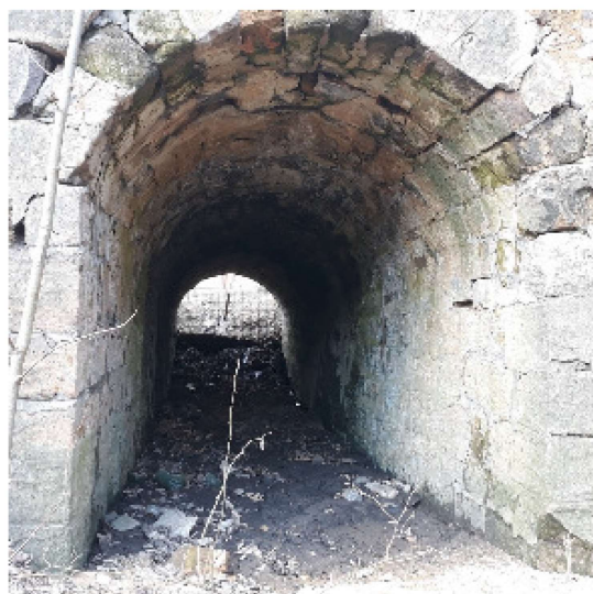
Silnice III/27814 Záskalí, opěrná zeď včetně propustku