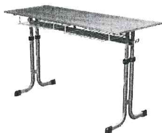
Schéma je ilustrativní pro představu - nadřazen popis: V případě stolu umožňujeme jiné, kvalitativně a technicky obdobné řešení.