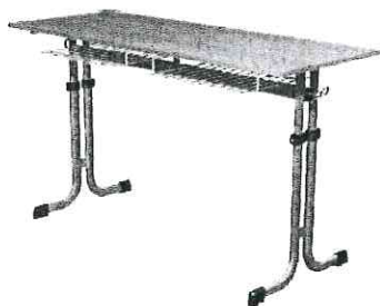
Schéma je ilustrativní pro představu - nadřazen popis: V případě stolu umožňujeme jiné, kvalitativně a technicky obdobné řešení.