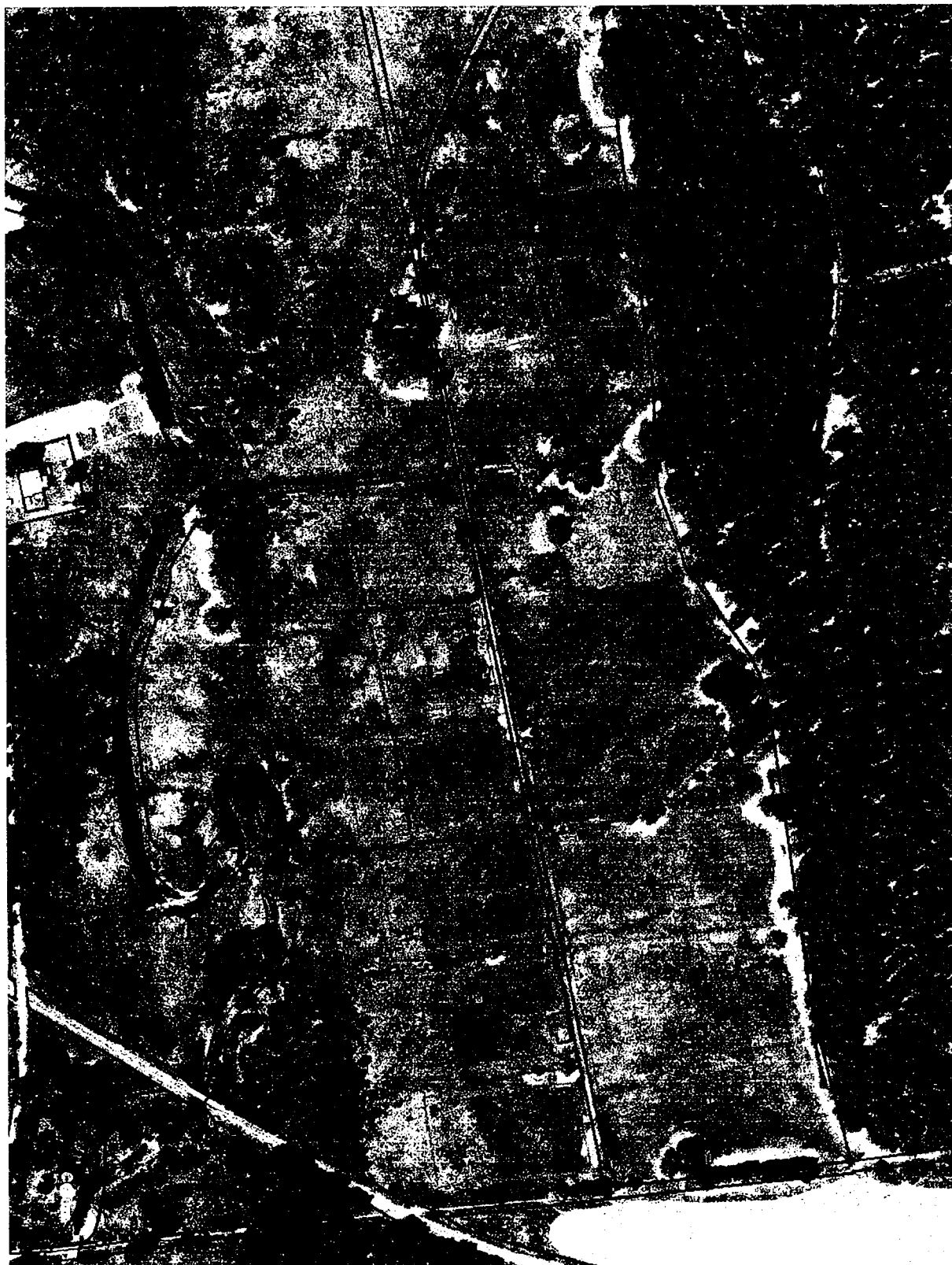
Černý Kříž – CK 1-8, k. ú. České Žleby