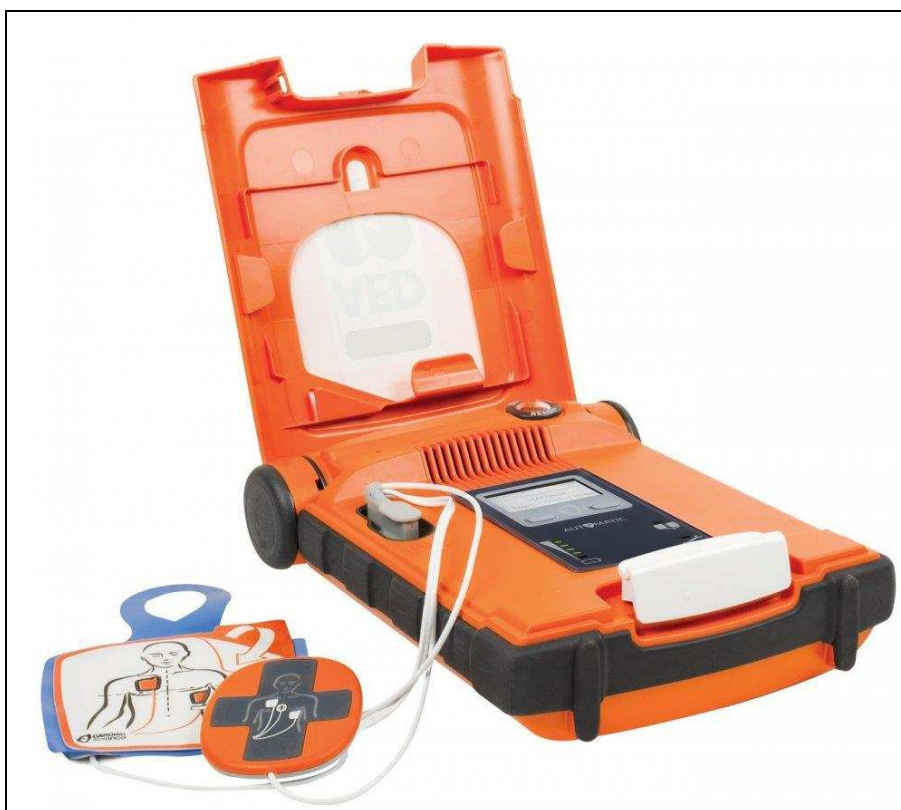
Obr. 1 - AED Defibrilátor ZOLL Powerheart G5

Automatický externí defibrilátor PowerHeart G5 je defibrilátor s širokou škálou unikátních parametrů, které z něj dělají uživatelsky nejbezpečnější a zároveň nejpřístupnější AED na trhu. Mezi tyto parametry patří: