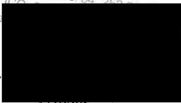
..... Mgr. .... starosta