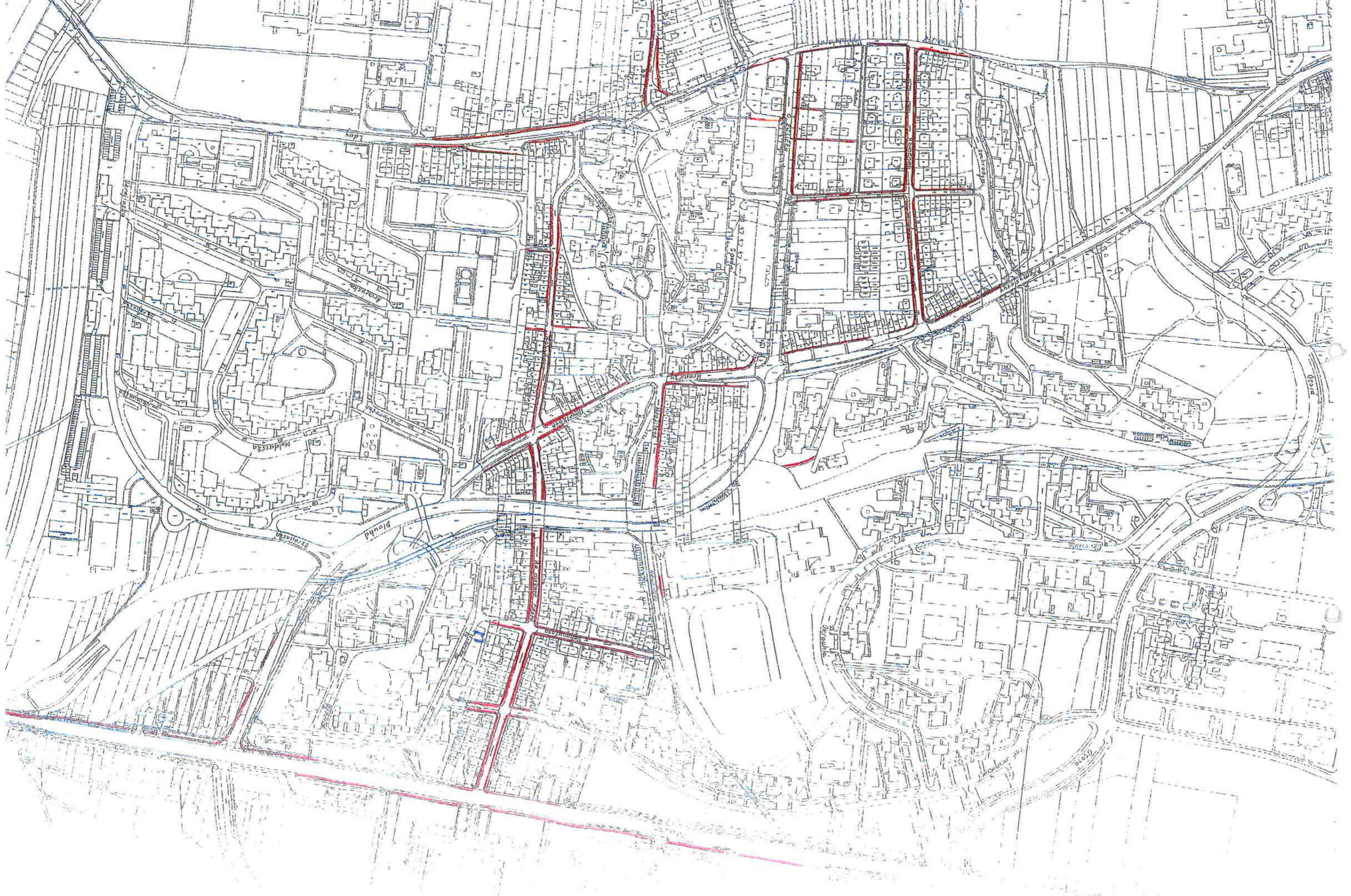
Príloha č. 1 ke smlouve o dílo č. 08-064/10/TS - Vymezení udržovaných a čistících chodníků a ploch