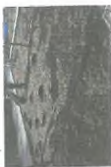
6. Zdielky s zvonkami travných pásů, které s výhledem umožňují návaznost výhledu a přehlednost celého areálu.