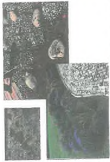
4. travní pásy s trávou a okrasnými květinami v rámci udržování zelené vlny