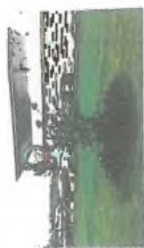
3. rozdílní úroveň parku bude tvořena i rozdílnými úrovněmi terénu. Na každém stupni bude umístěn stromy a keřoviny.