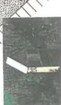
2. vstupní vstředí pro výhled dovnitř budovy