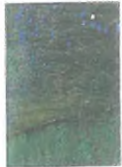
7. Na výhledu část parku bude zajištěna kolářská stezka a příjezd vozů s osobními vozidly.