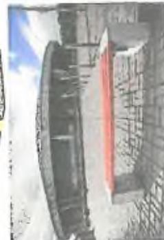
5. lavice jsou umístěny v blízkosti vstupu. Lavice pro organizování akcí v parku.