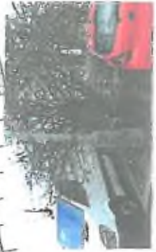
8. V celém parku bude provedena odvodňovací síť a systémy odvodnění, které v závislosti na typu povrchu budou odvádět vodu do přírodních nádrží. Dle typu povrchu a odvodnění bude provedena i odvodňovací síť. Systém je navržen jako systém odvodnění povrchu.