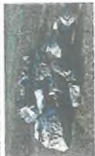
1. ústřípní pro sběratelství žlutých speciálních odpadů