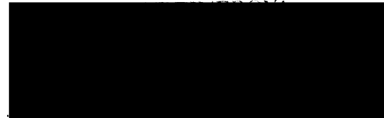
Razítko a podpis (případně funkce) osoby oprávněné zastupovat Dodavatele