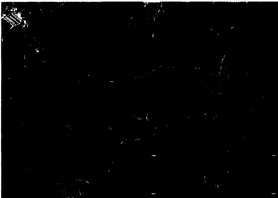
Račínská prameniště – detail