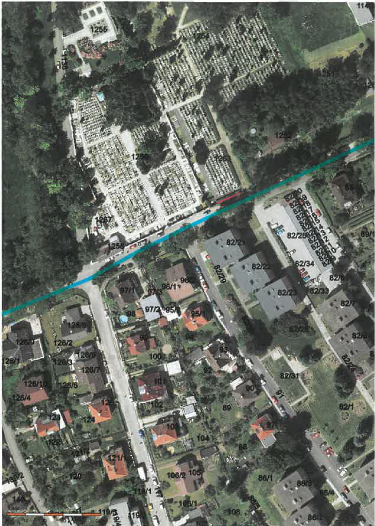
·Příloha č. 2 – situace s orientačním vyznačením zdi a fotodokumentace