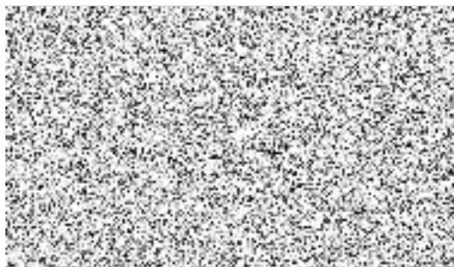
ekonomka provozní jednotky na základě plné moci