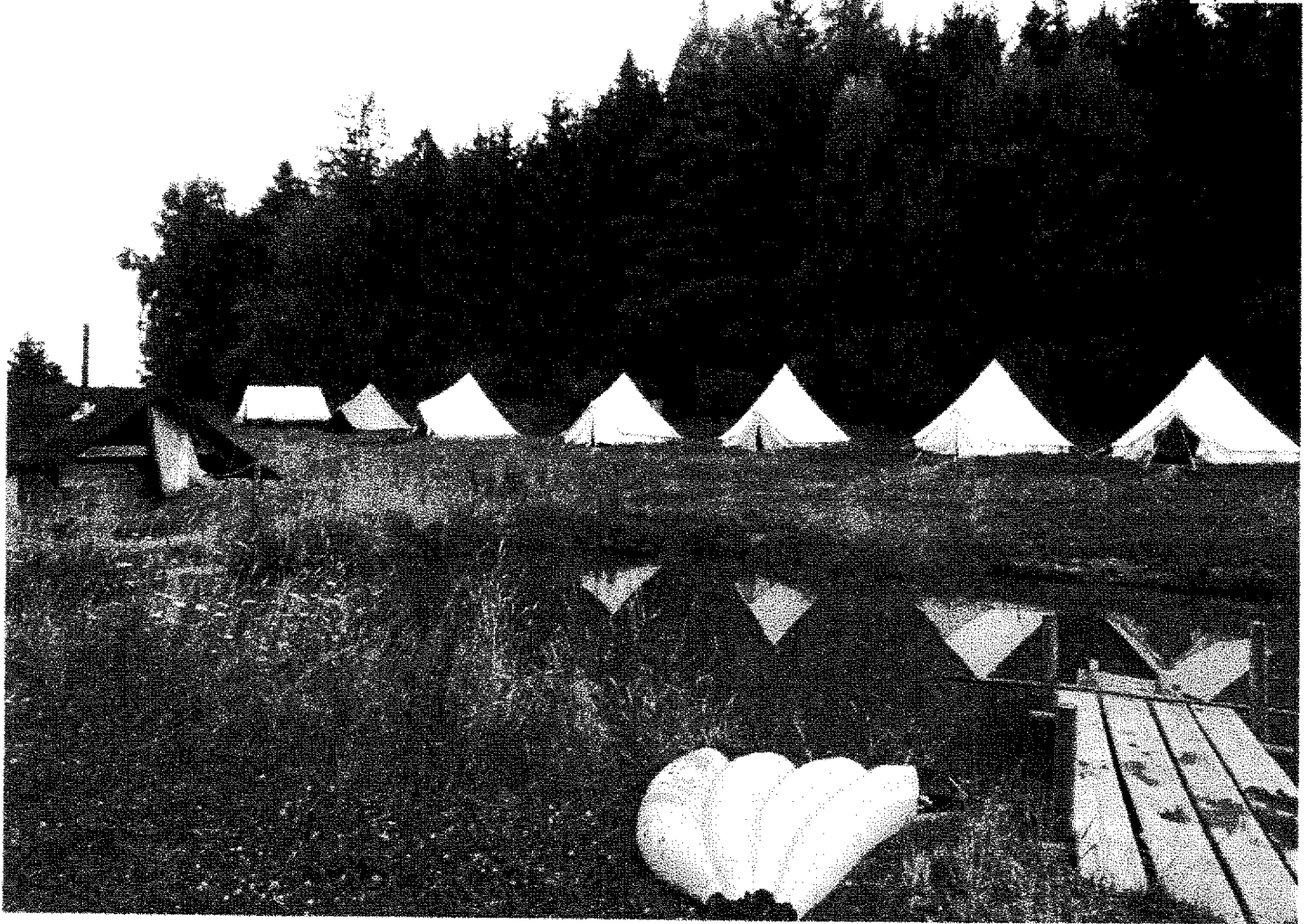
Průběh č. 9 - 2 ke fotografii Táborště 2 roku 2021