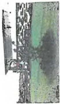
3. Společnost odhadla cenu za tuto část budování, takže bylo rozhodnuto, že tato část bude realizována v pozdější fázi