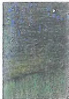
7. Ve výhledu část parku bude zřízena v blízkosti budovy a přístupu k budově, kde bude zřízena v blízkosti budovy a přístupu k budově