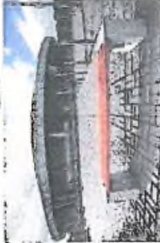
5. Lavičky jsou umístěny v prostoru, kde budou umístěny lavičky. Lavičky jsou umístěny v prostoru, kde budou umístěny lavičky