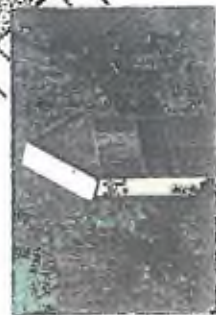
2. Vozovna slouží jako plocha, bude rozšířena vzhledem k budově