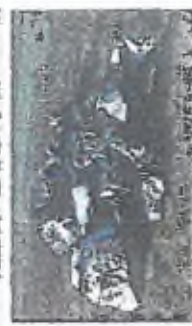
1. Úprava povrchu chodníku, budování upravené vyhledané cesty