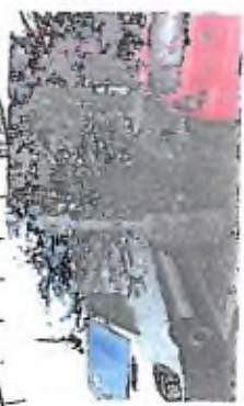
8. V celém parku bude provedena úprava, a dle plánu vzhledu parku bude provedena úprava, a dle plánu vzhledu parku bude provedena úprava