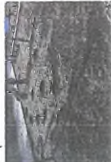
6. Dříve se pracovalo s jinými materiály, nyní se využívá materiál, který je vhodnější pro tyto podmínky