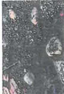
4. Hlavní záměr je stavba a dokončení stavby v rámci úpravy parku, realizace jednotlivých částí