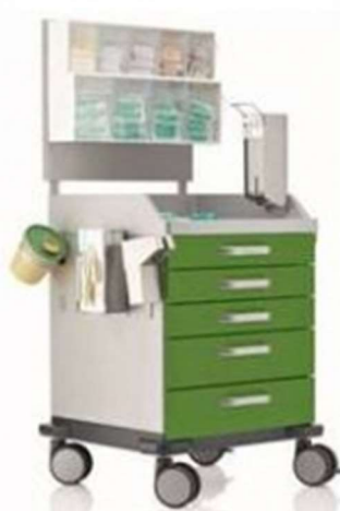
Ilustrační obrázek č. 2 požadovaného anesteziologického vozíku