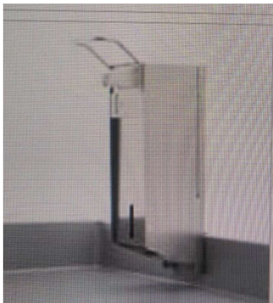
Příklad dávkovače dezinfekce