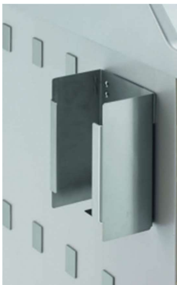
Příklad nerez zásobníku rukavic