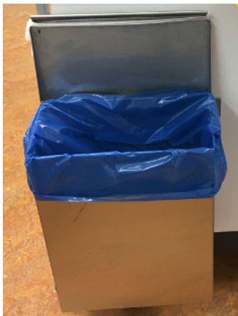
Příklad nerezového odpadkového koše