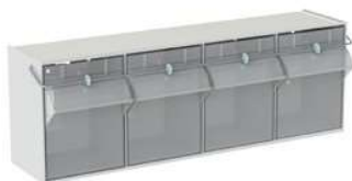
Příklad výklopných boxů.