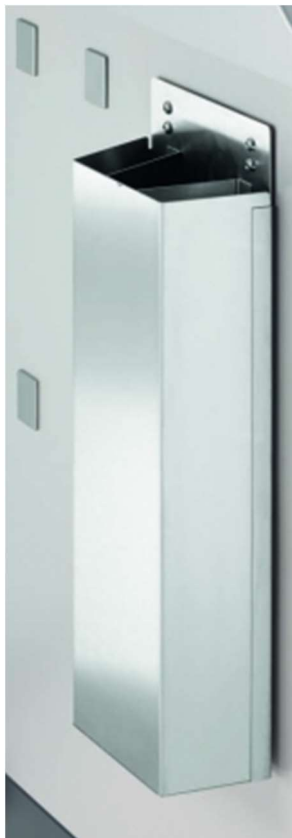
Příklad toulce pro katetry