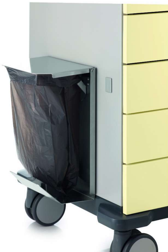
Příklad držáku plastových pytlů