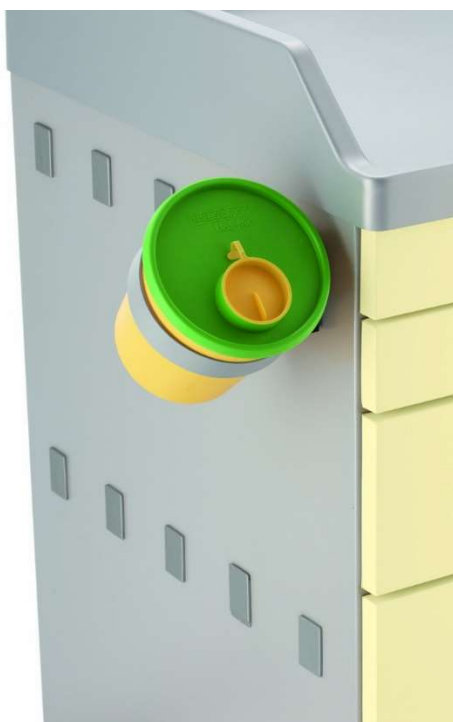
Příklad sada boxů na odpadky