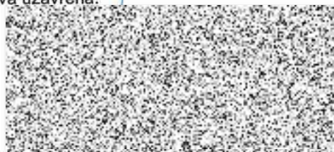
razítko a podpis pojistníka