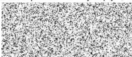
jméno, příjmení a podpis osoby pověřené pojistitelem uzavřením pojistné smlouvy

Prohlašuji, že jsem jako oprávněný zástupce pojistitele předložil návrh pojistné smlouvy a dne 30.04.2022 převzal sdělení o jeho přijetí, čímž byla smlouva uzavřena.