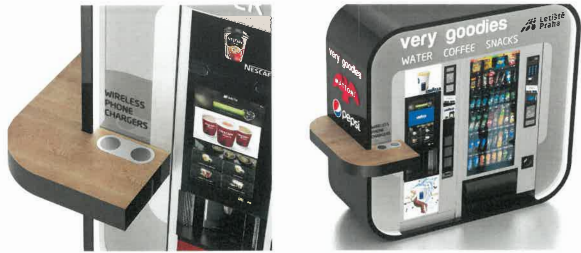
Automaty v opláštění + případný collection point: