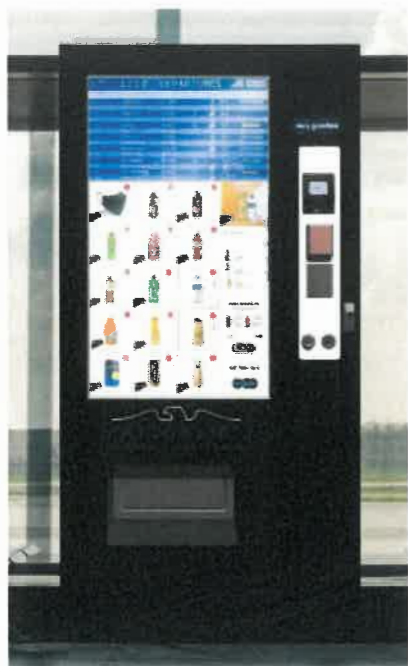
Automaty Druh B (teplé nápoje):