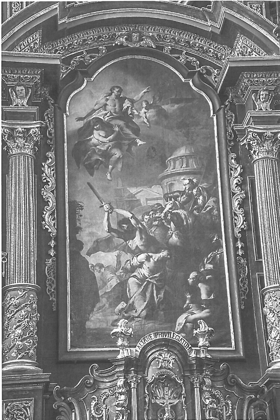
Celkový pohled na obraz. Na snímku je vidět extrémní zvlnění plátěné podložky v dolní části obrazu