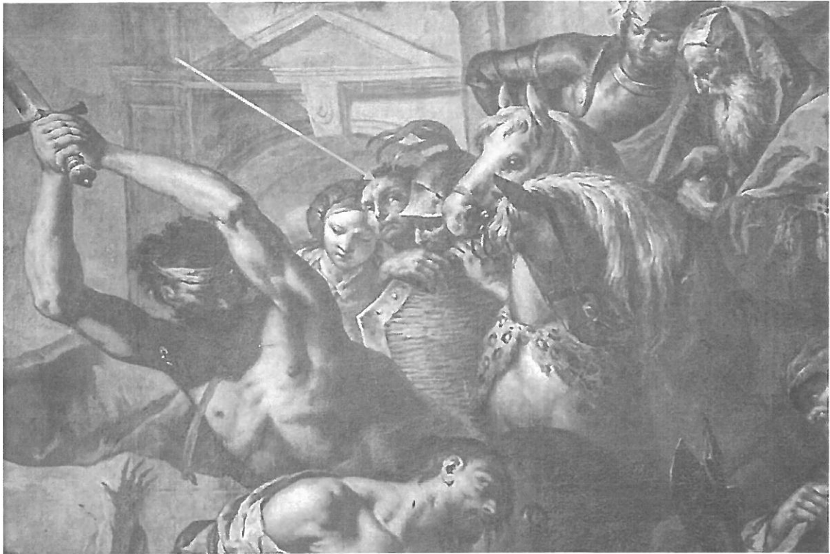
Šipka ukazuje na možný autoportrét malíře