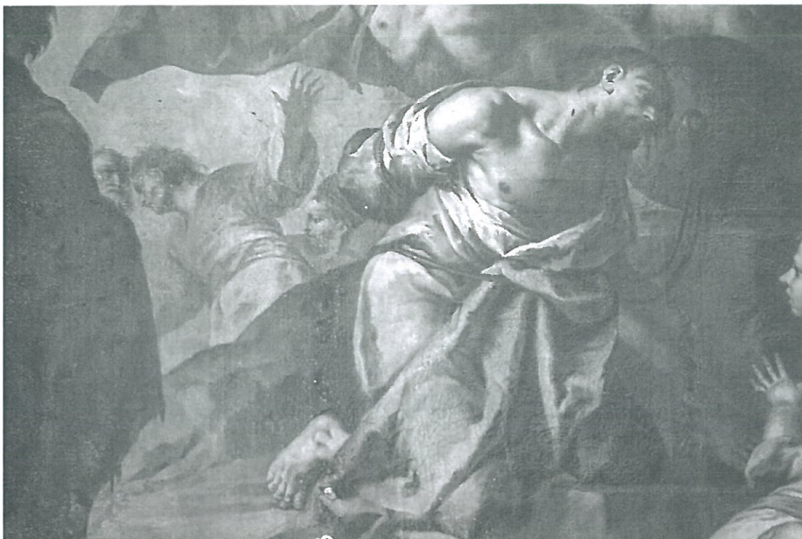
Detail vyznačení napínacího rámu do barevné vrstvy a výrazná miskovitá krakeláž v místě rámu