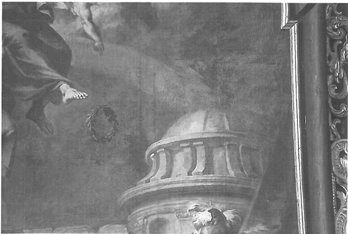
Detail ztmavých oprav a zvlnění plátěné podložky. Na snímku je vidět výrazná miskovitá krakeláž