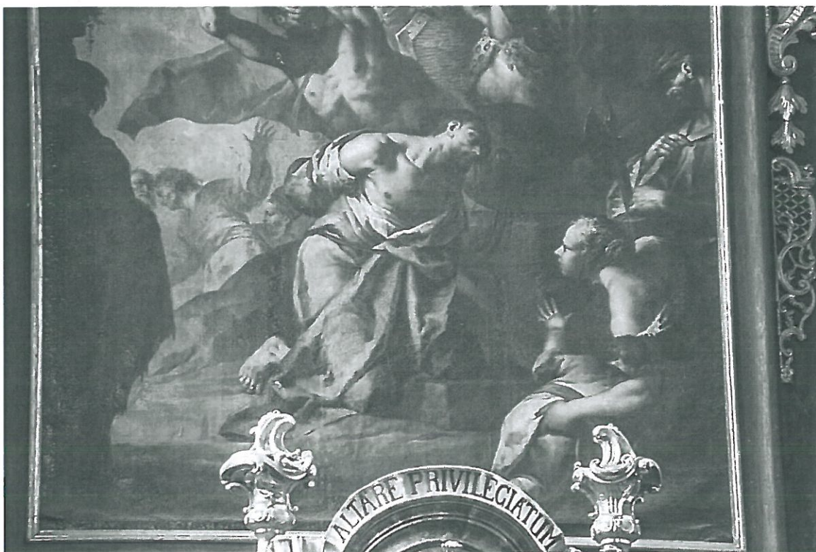
Snímek ukazuje zvlnění plátna v dolní části obrazu