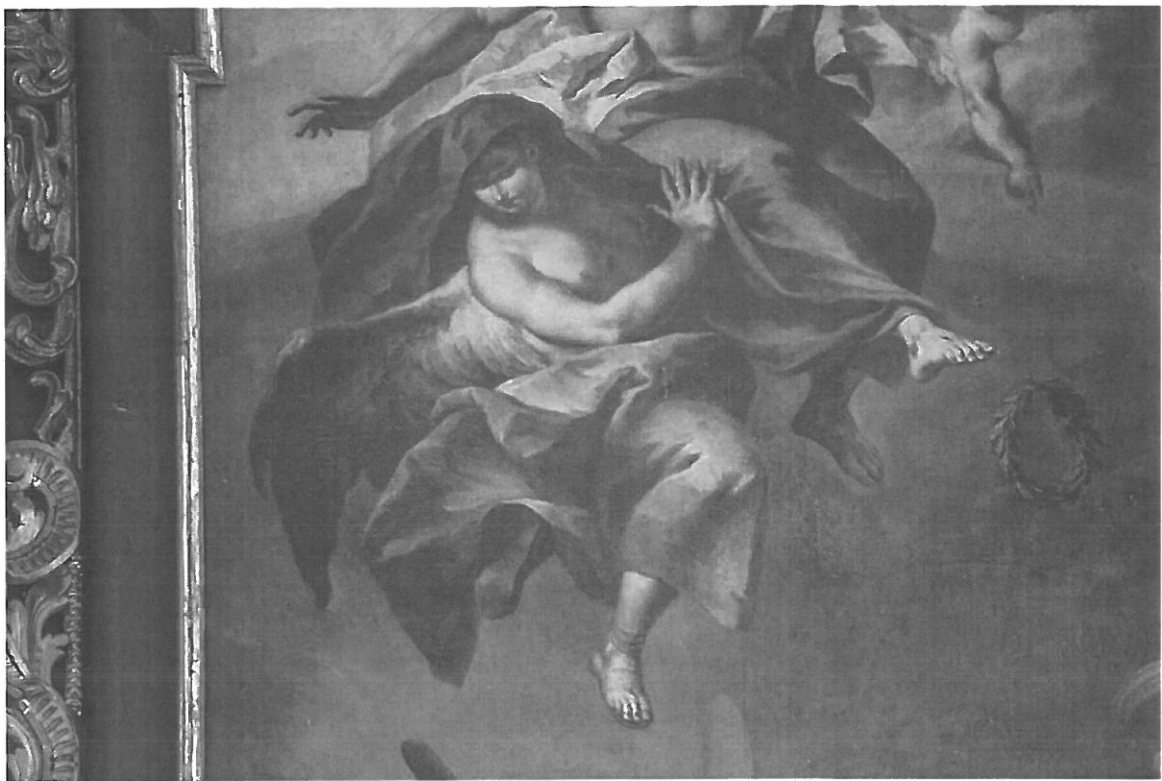
Detail oprav a nečistot