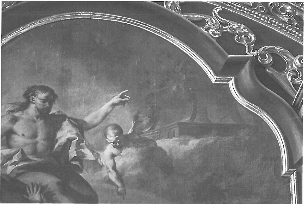
Detail ztmavých oprav a nečistot na povrchu barevné vrstvy