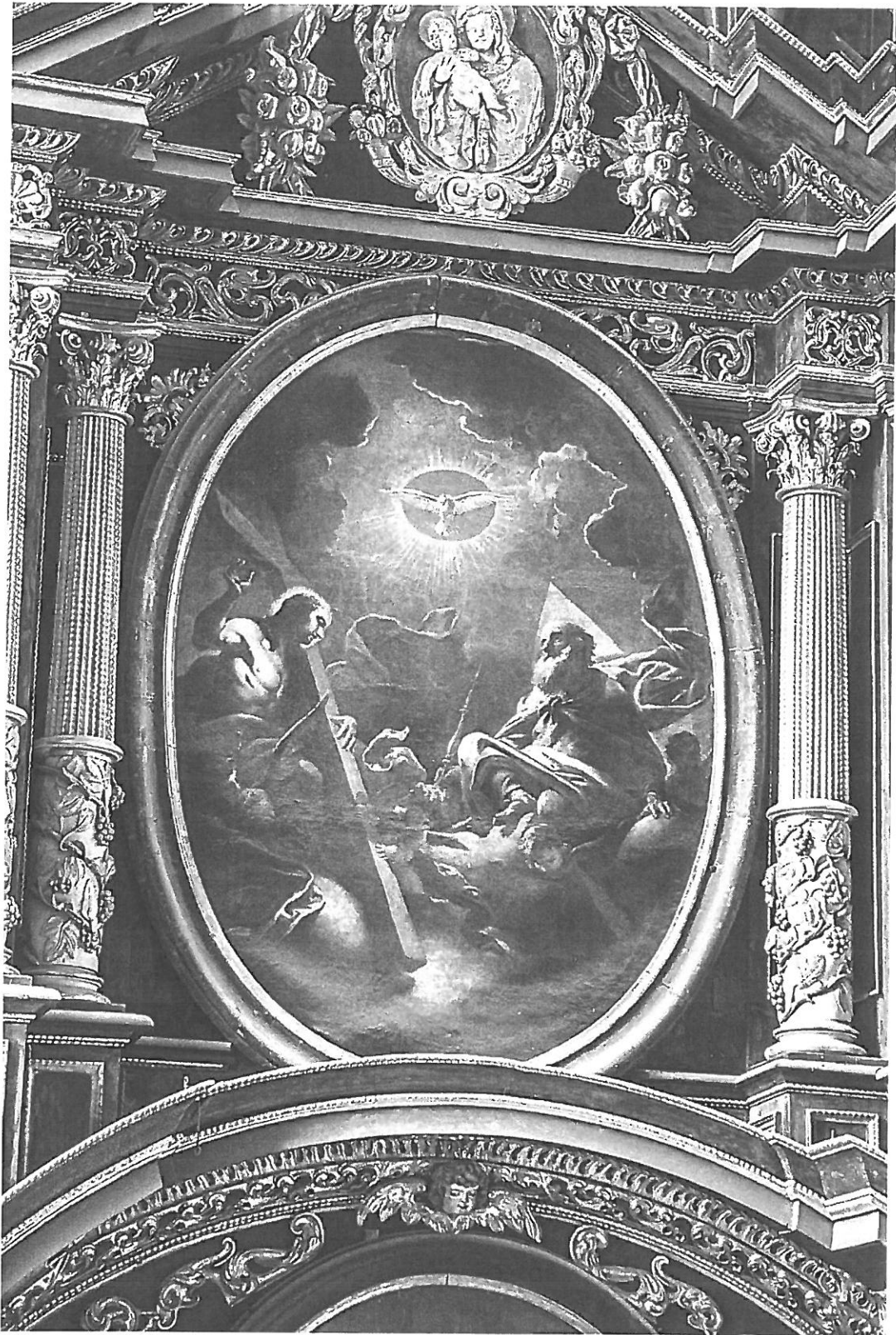
Celkový pohled na rám. Na povrchu rámu jsou vidět nevyhovující retuše, které jsou dnes zešedlé