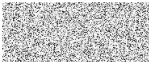
za Zhotovitele – razítko a podpis Ing. Ctibor Hůlka ředitel