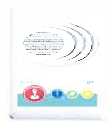
Komunikační jednotka bezdrátová 868 IP 110312.11 / KJB IP