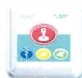
Signalizační jednotka bezdrátová 868 IP 110251.11 / SIJB IP