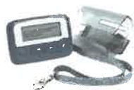
Pager textový 110680.01 / PT IP