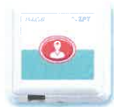
Zásuvka volací šňůry s tlačítkem IP 110165.01 / ZVST IP