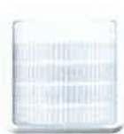
Svítilno IP 110441.01 / SV IP