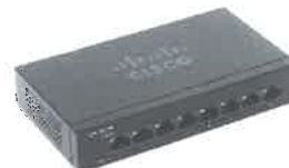
Switch 8 portů 110660.01 / SW8 IP