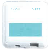
Zásuvka ethernet IP 110030.01 / ZE IP