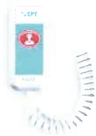
Volací šňůra IP 110150.01 / VS IP