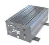
Pagingová ústředna 110670.01 / PU IP