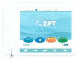
Terminál personálu IP ACRIOS 110013.02 / TP IP