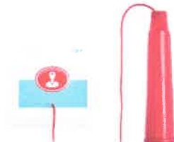
Táhlo nouzového volání s tlačítkem IP 110411.02 / TTNV IP