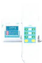
Služební jednotka s displejem IP 110331.01 / SJD IP