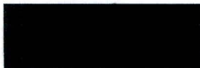
starosta města Hlučína

27/4a) Zastupitelstvo města Hlučína rozhodlo o uzavření Smlouvy o kompenzaci nákladů za zajištění ubytování osobám postiženým ozbrojeným konfliktem na Ukrajině dle předložené přílohy č. 1 mezi městem Hlučín, se sídlem Mírové náměstí 23, 748 01 Hlučín, IČ: 00300063 a obcemi ve správním obvodu obce s rozšířenou působností Města Hlučín, které vyčlení ubytovací kapacity ve svém zařízení pro dočasné nouzové přístřeší nebo nouzové ubytování vysídlených osob prchajících z území státu Ukrajina.