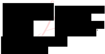
ředitel Divize 2 S u b t e r r a , a . s .