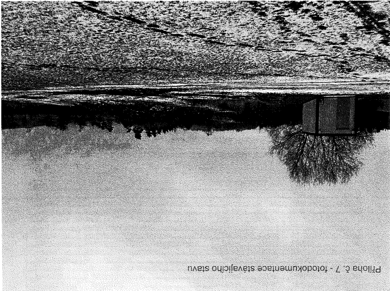
Príloha č. 7 - fotodokumentace stávajícího stavu