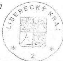
Petr Skokan hejtman Libereckého kraje