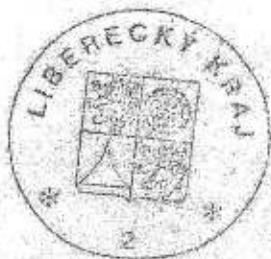
Petr Skokan hejtman Libereckého kraje

Podkladová dokumentace je uložena u organizace.