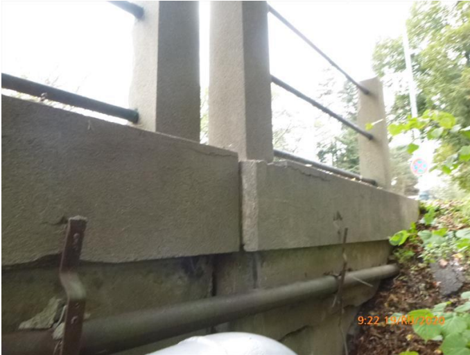
Održení části pravého křídla a římsy.