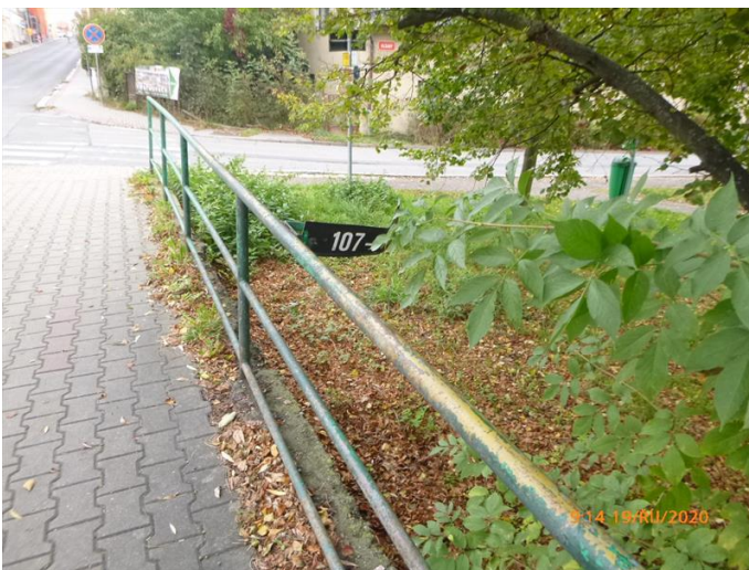
Levá strana a zábradlí.