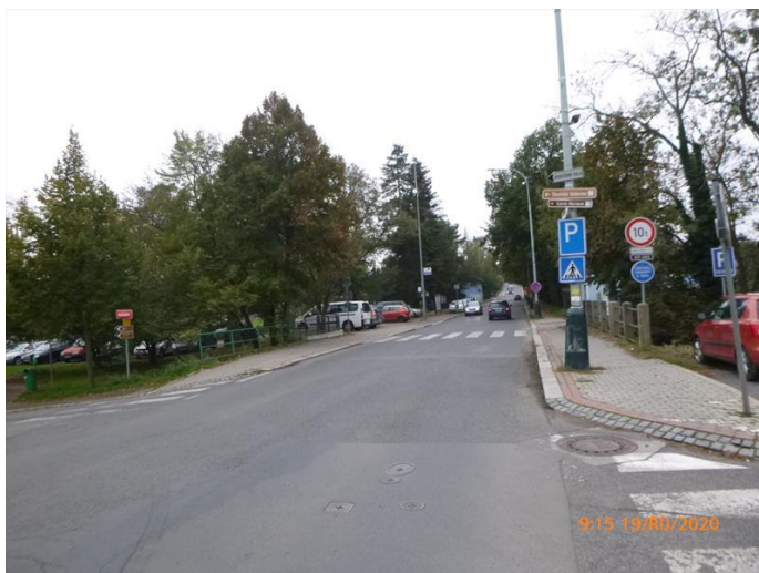
Pohled ve směru staničení.