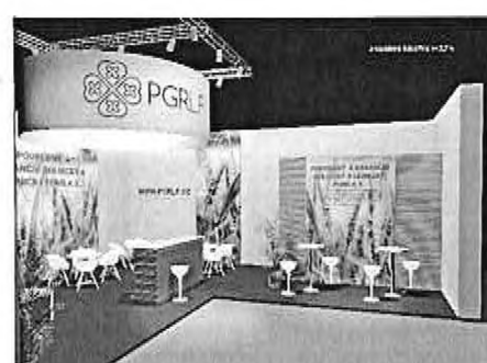
vizualizace národní 2 EXPOZICE_PGR LF_10x9 m_22_2021 all 5