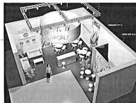
náhledová perspektiva EXPOZICE_PGR LF_10x9 m_22_2021 all 5