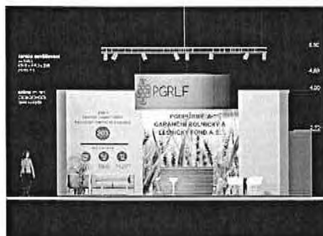
pohled čísel 1_50 EXPOZICE_PGR LF_10x9 m_22_2021 all 5