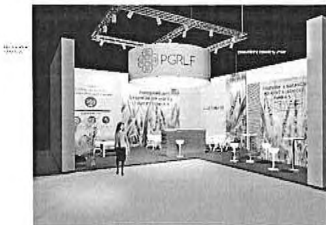
vizualizace národní 1 EXPOZICE_PGR LF_10x9 m_22_2021 all 5