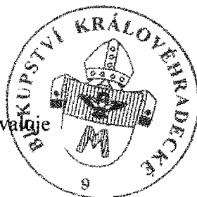
Mons. Jan Vokál diecézní biskup

Biskupství královéhradecké schvaluje Č.j.: BIKR 1077/2022 Dne: 23. 5. 2022