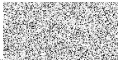
Otomar Exner Na základě plné moci