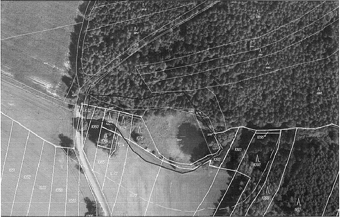
EVL v Kopanínách - oprava hráze a funkčních objektů rybníka, částečné odbahnění zátopy rybníka