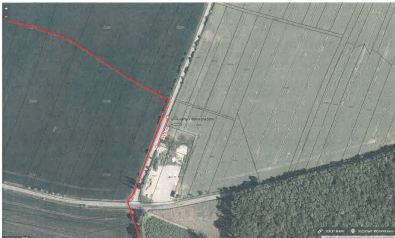
Obrázek 1 Na obrázku výše je zobrazeno odstavné parkoviště, kde k úniku nafty došlo. Následně nafta tekla příkopem podél silnice v délce cca 55 m.

Pro přehlednost jsou dále zobrazeny mapy a zakres úniku nafty.