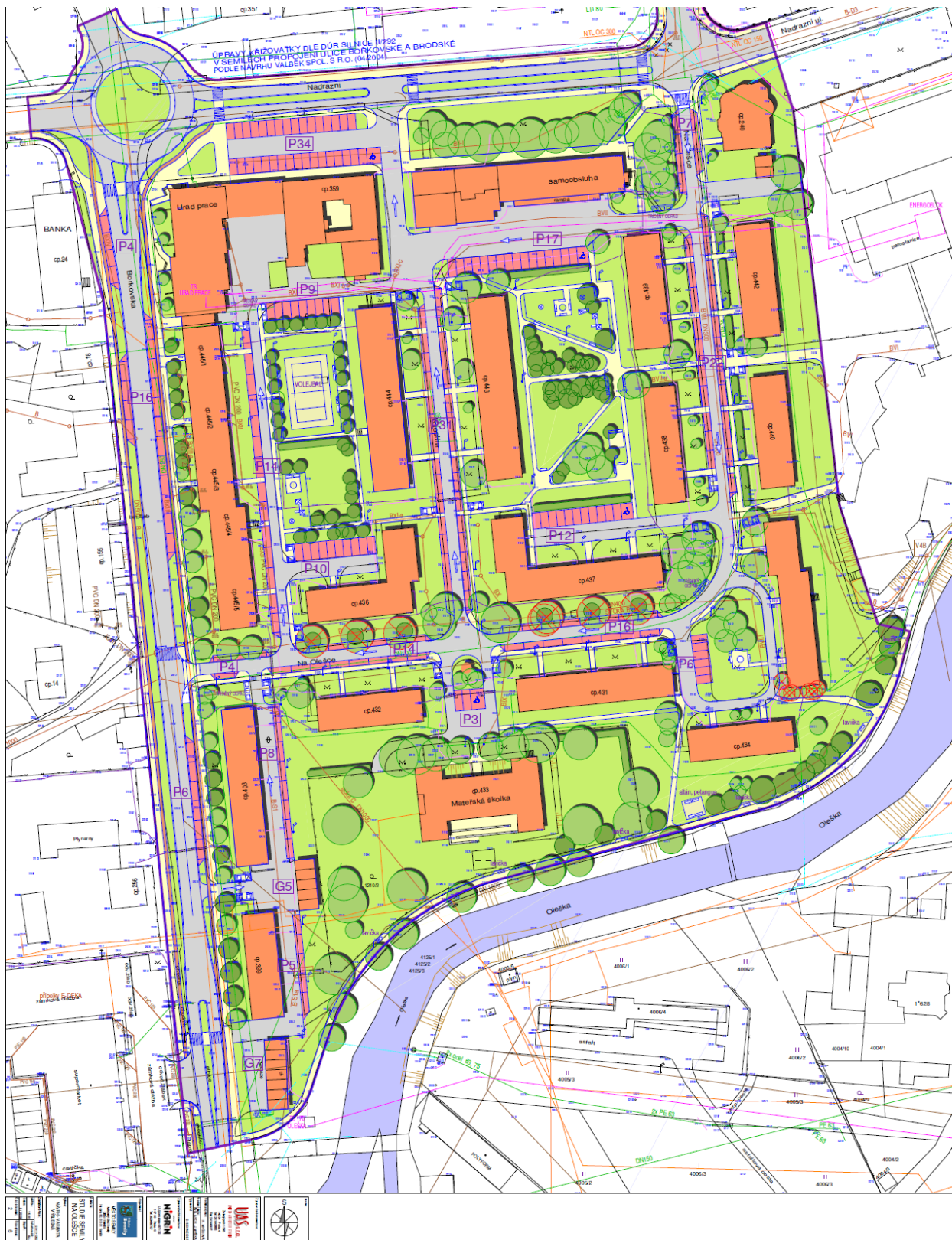
Příloha č. 1: Studie sídliště Na Olešce z roku 2008