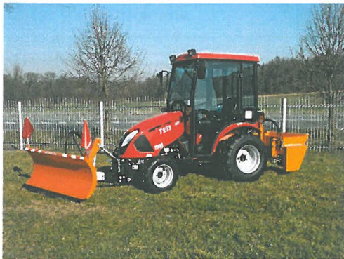
Sněhová radlice ORM1800

plastová násypka s nerezovým dnem násypky, nerezové lopatky, clony pro zimní posyp, který zajistí jednotné rozhození posypového materiálu po celé ploše. nerez adaptér, síto, krycí plachta, hydraulické ON/OFF, kardan