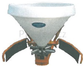
Rozmetadlo soli CONE 400 WINTER