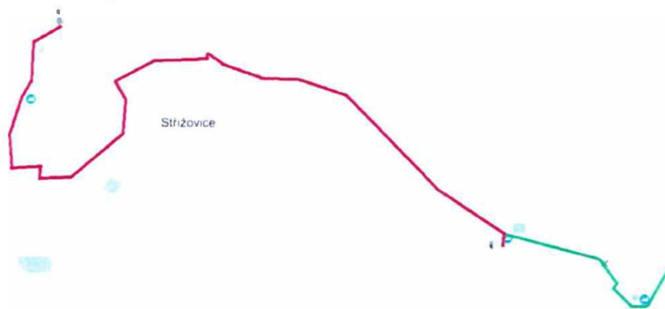
Obr. Schéma budované optické sítě, zelená - hotové trasy, červená - tento projekt