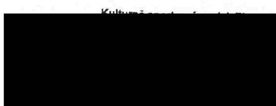
člen zastupitelstva kraje předseda