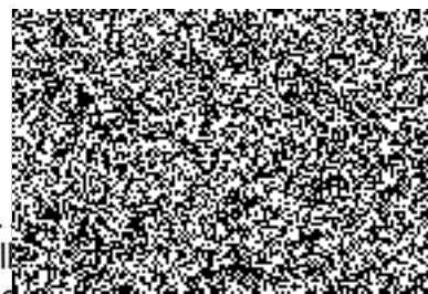
ředitel krajského úřadu kupující