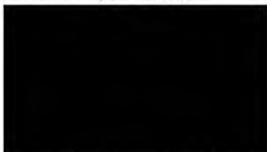
pověřená řízením odboru SOV Magistrátu hlavního města Prahy (za poskytovatele)