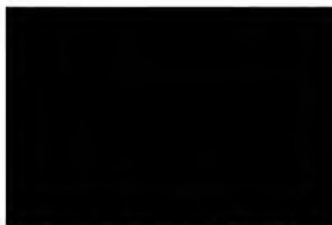
ředitelka společnosti Fosa, o.p.s. (za příjemce)