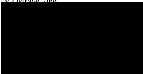
starosta městského obvodu