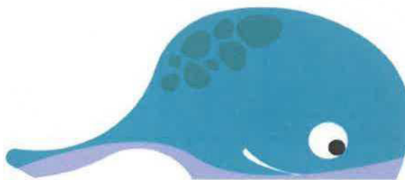
Barevný odstín podkladní barvy vnější boční stěny: NCS S1565-B (TYRKYS BLUE)