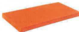
Obr.2. Vyobrazuje stupnici s bezpečnostním protiskluzem