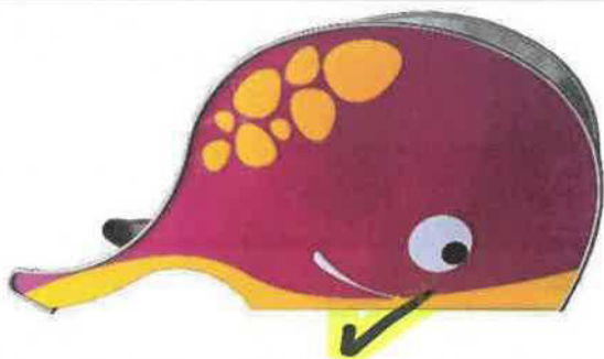
Barevný odstín podkladní barvy vnější boční stěny: NCS S2065-R20B (TELEMAGENTA)