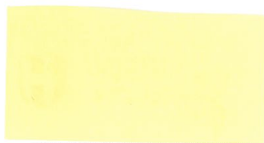
Mgr. Ondřej Výborný starosta města Holic