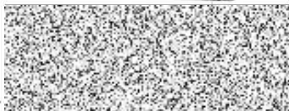
..... plk. Ing. David Pouč ředitel HZS Královéhradeckého kraje

Česká republika Hasičský záchranný sbor Královéhradeckého kraje nábořil. U Přivozu 122/4 500 03 Hradec Králové IČ: 70 88 25 25 CZ-NUTS: CZ0521 14