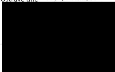
Základní škola a Mateřská škola Ostrava-Poruba, Ukrajinská 19 příspěvková organizace