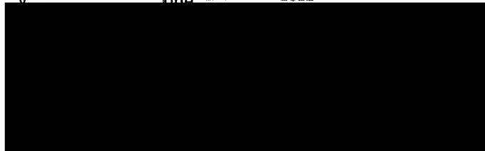
Zdravotní pojišťovna ministerstva vnitra ČR