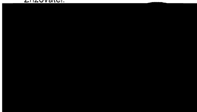
Martin Záhoř náměstek hejtmána pro oblast sociálních věcí