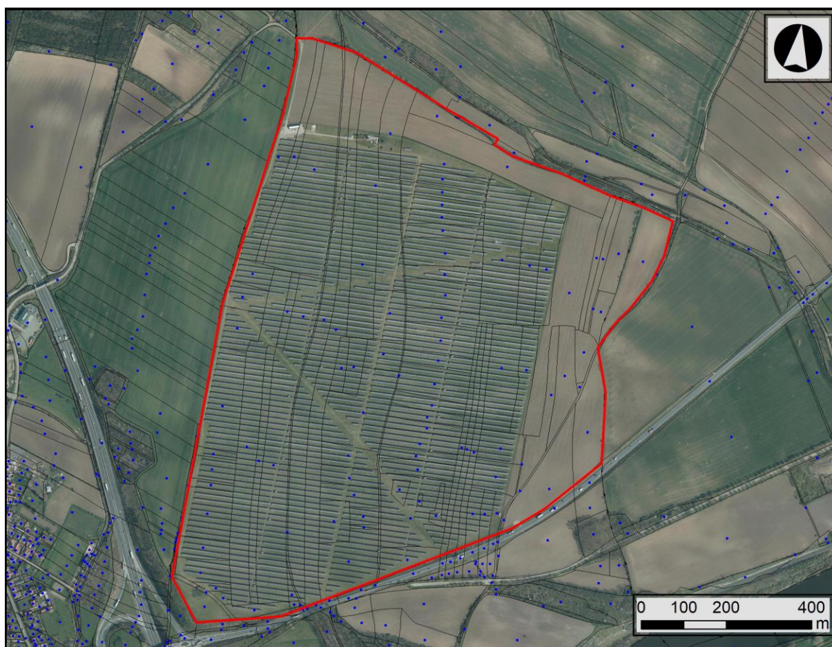
Obrázek 1: Orientační vymezení plochy průzkumu