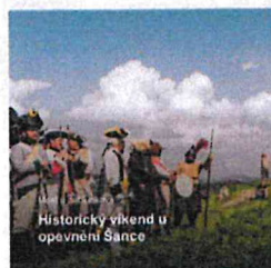
Historický víkend u opevnění Sance