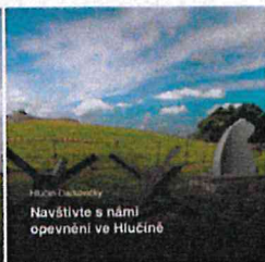
Navštivte s námi opevnění ve Hlučíně