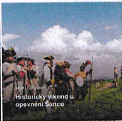
Historický víkend u opevnění Sance