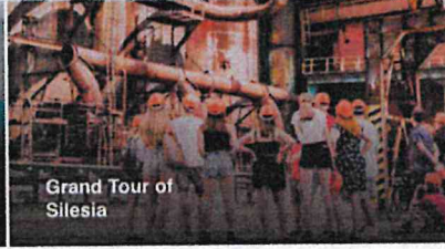
Grand Tour of Silesia