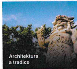
Architektura a tradice

We create awesome experiences by showcasing some of the best places and activities in the country