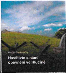
Navštivte s námi opevnění ve Hlučíně