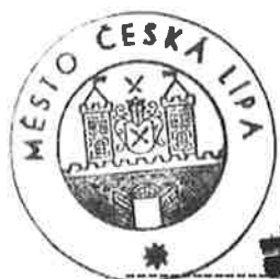
Město Česká Lípa starosta Jiří Pazourek